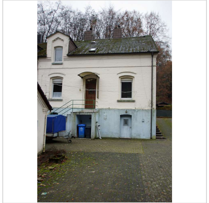
Ansicht Rückseite des Hauses