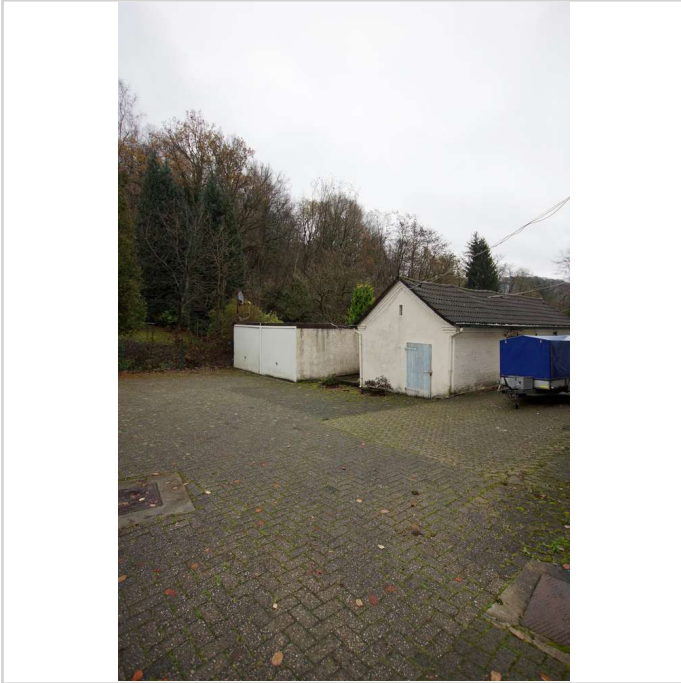
Ansicht Garagen u. Schuppen

Zimmer: 8,00 Wohnfläche ca.: 140,00 m 2 Kaufpreis: 260.000,00 EUR