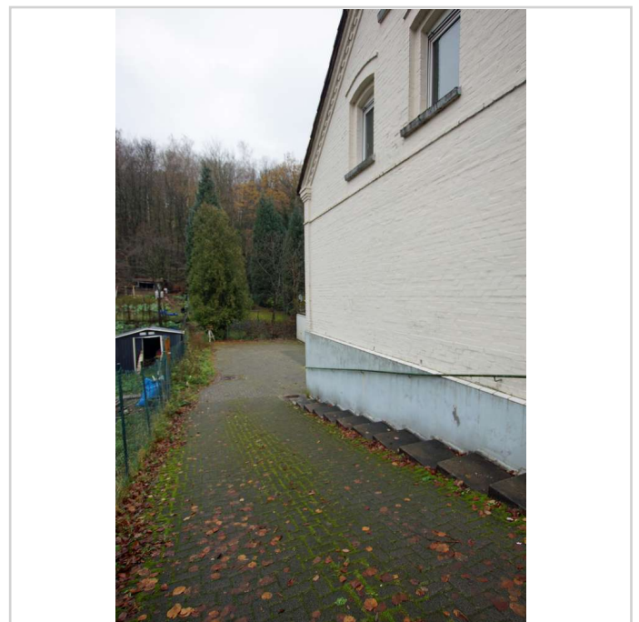
Zufahrt zur Garage